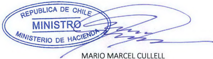
MARIO MARCEL CULLELL MINISTRO DE HACIENDA

“POR ORDEN DEL PRESIDENTE DE LA REPÚBLICA”